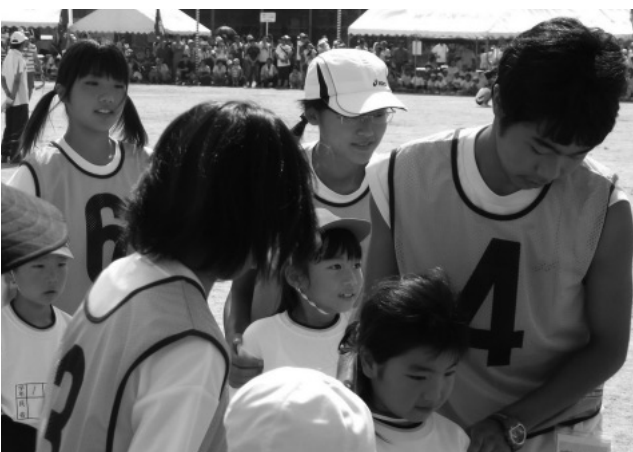
写真 生徒同士が主體的に活動を行うのが「増中マナツプ隊」の特徴。隊長の号令の下、生徒同士で打ち合わせを行い、それぞれの役割をこなしていく中で主体性が培われていく

生徒や保護者のアンケート評価も高い。「秩序が保たれ安全で安心できる学校に近づいている」（3.5点）、「学校は交通マナーの徹底を図る努力をしている」（2.3点）、「学校はボランティア活動の推進を図っている」（1.7点）（いずれも回答は4段階評価で最高は10点、最低はマイナス10点、平均値は0点）などの項目で、いずれも平均値を上回っており、生徒や保護者からも一定の評価を得ていることが分かる。